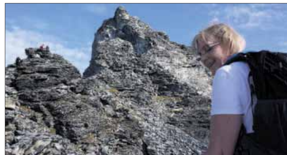
UTFORDRING : Man skal passe seg for hvor man setter foten på vei opp den utfordrende ruten oppover fjellsiden.