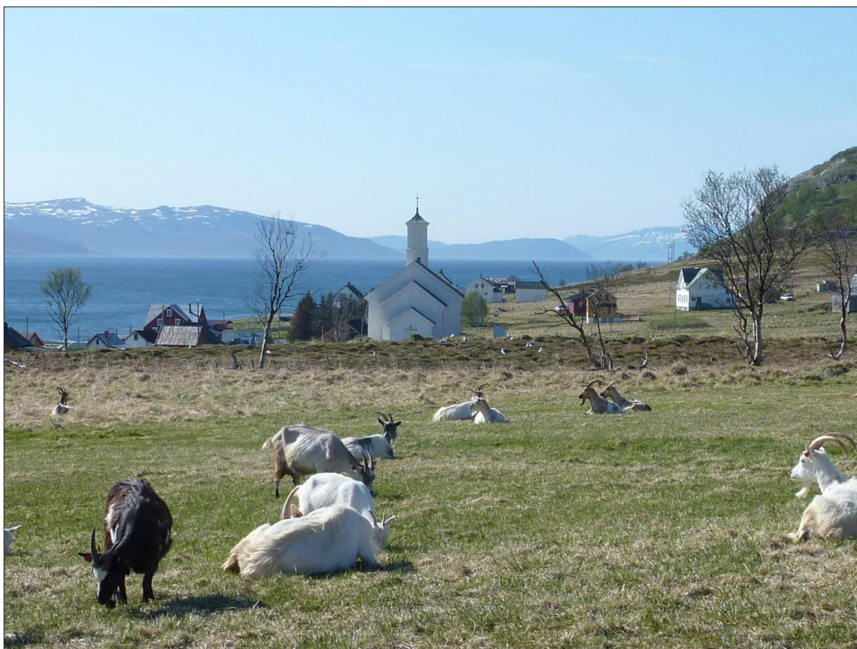
Over: Sett mot Helgøyfjorden. Under: Sett mot Vannkista. mai 2010.