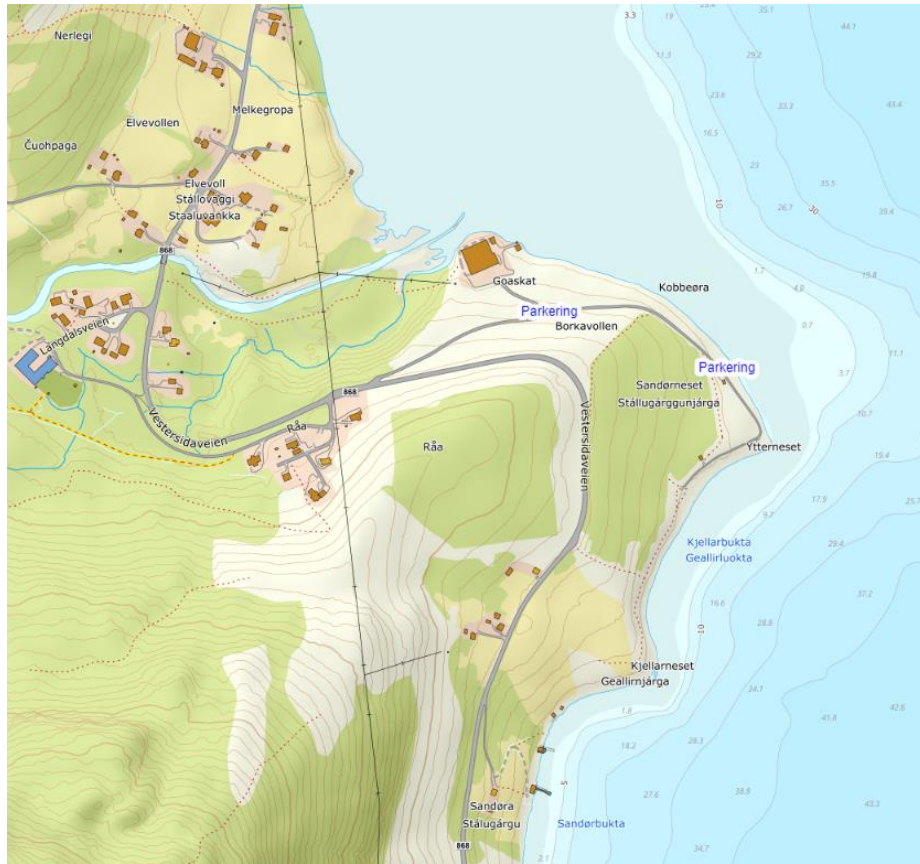
Parkering på Sandørneset.